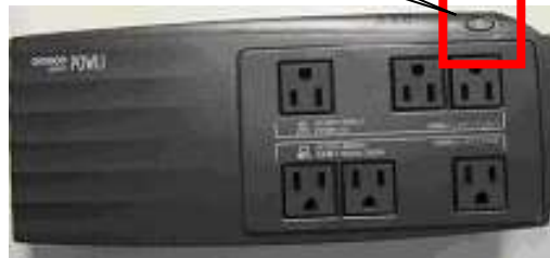
OMRON POWLI BZ50T